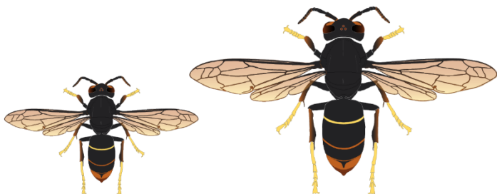
Fondatrice (20 à 32 mm)

Les comptages sont à faire au moment du renouvellement de l'appât. Le renouvellement est conseillé 1 fois par semaine pour une efficacité optimale du piégeage. Compter les fondatrices et ouvrières de frelon à pattes jaunes en les distinguant d'abord du frelon d'Europe. Les fondatrices se distinguent des ouvrières par leur taille.